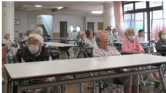
↑1階の入所さんが「ここに幸あり」「しゃぼんだま」などを歌われました。