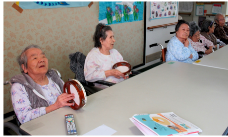
←↑2階で行ったレクリエーションでは、入所さんが太鼓のリズムに合わせて、「みかんの花咲く丘」「茶摘み ちゃっ 」などをうたわれました。