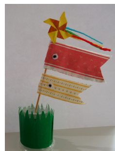
↑→デイケアの利用さんが兜 かぶと の壁面とこいのぼりの飾りを作製されました。