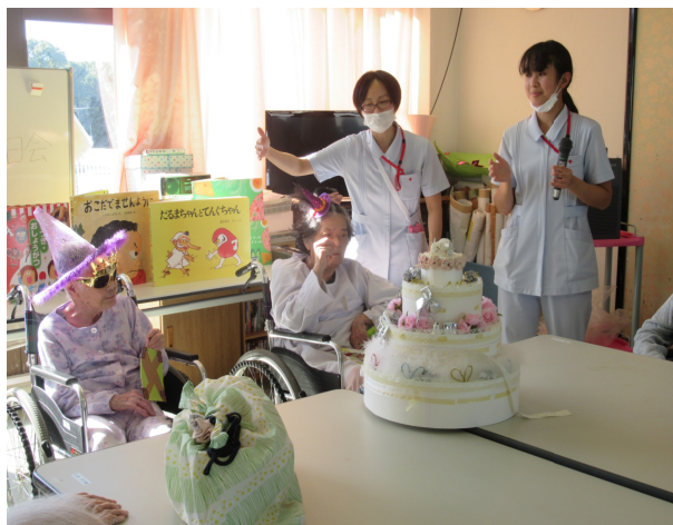
11月26日老健の誕生日会を行いました。誕生者となられた方にハロウィンの格好をしていただきお祝いをしました。