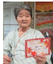
11月22日、介護医療院の誕生日会を行い、入所者のみなさんで誕生者のお祝いをしました。