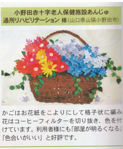
小野田赤十字老人保健施設あんじゅ 通所リハビリテーション 様(山口県山陽小野田市) かごはお花紙をこよりにして格子状に編み 花はコーヒーフィルターを切り抜き、色を付 けています。利用者様にも「部屋が明るくなる」 「色合いがいい」と好評です。

デイケアの利用者の方々 が作成された「花飾り」の 壁画が、介護情報誌「月 間デイ3月号」の「レク ラフト大集合」のコー ナーで入賞しました。