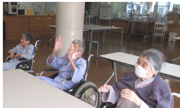
▲ 3月2日、介護医療院のレクリエーションで歌をうたった後、手の体操をされました。