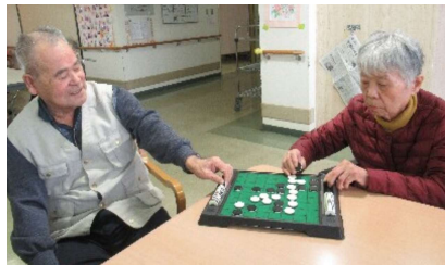
▶ 3月1日、老健の入所者さんがオセロを楽しまれました。