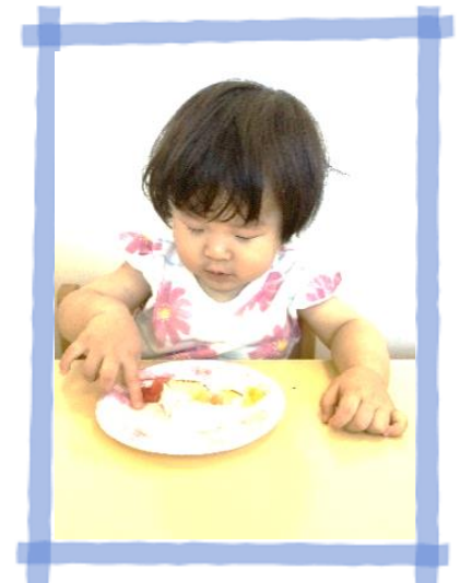
かわいいケーキができました♡