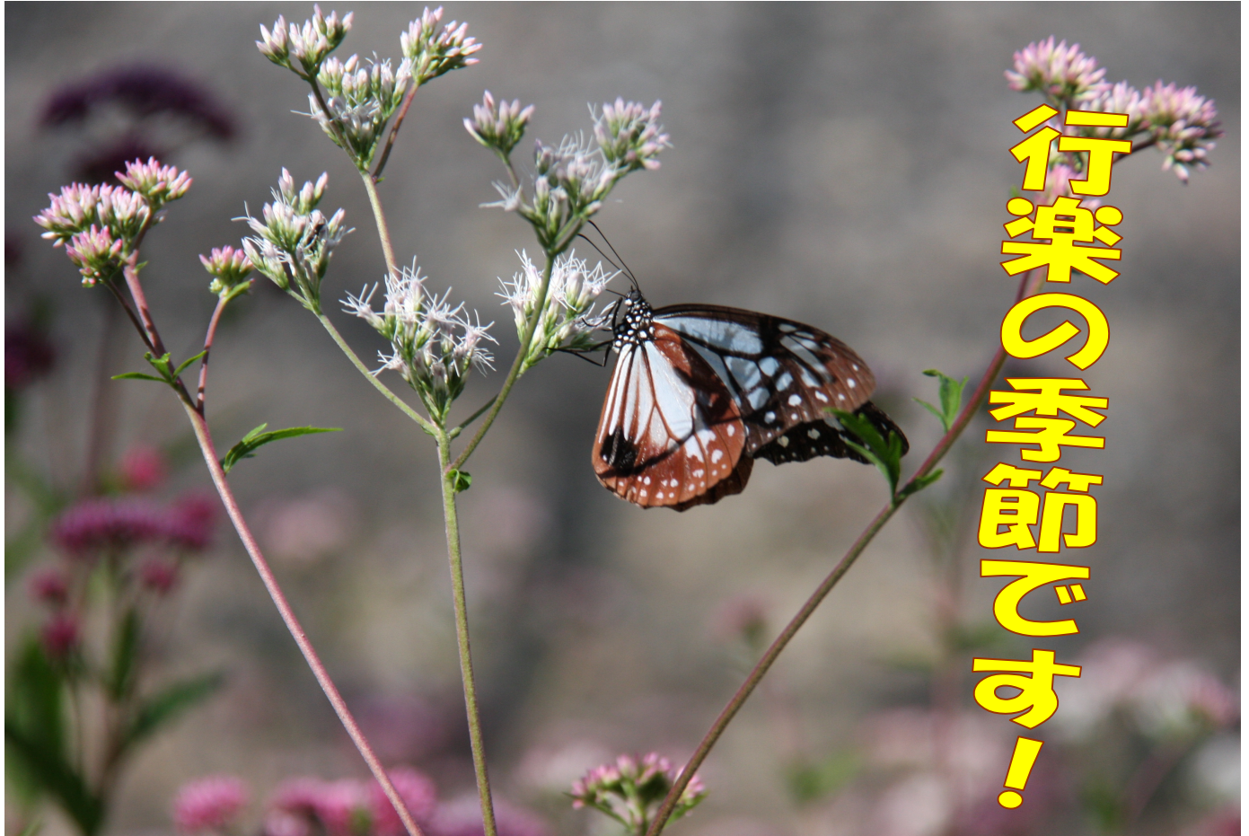
ヒヨドリバナにとまるアサギマダラ（竜王山）

旅する蝶として知られるアサギマダラは、1年のうちに、日本本土と南西諸島・台湾の間を往復していて、2011年には、和歌山県でマーキングされた個体が、2,500 km離れた香港で捕獲されたこともあります。ただし北上する個体と南下する個体は子孫の関係だそうです。このアサギマダラが、この時期竜王山にも飛来します。本山小学校による種蒔により群生地となったヒヨドリバナが好物のようです。