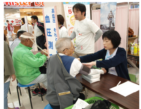
血圧も測ってみます。

小野田赤十字病院による看護の日行事では、ストレス度測定、体脂肪測定、血圧測定、相談コーナー（健康・医療・看護・介護・介護保険）、かわいい看護師・お医者さん・救護員になって記念撮影を行いました。あいにくの雨模様にも関わらず多数の方々にご来場いただきました。