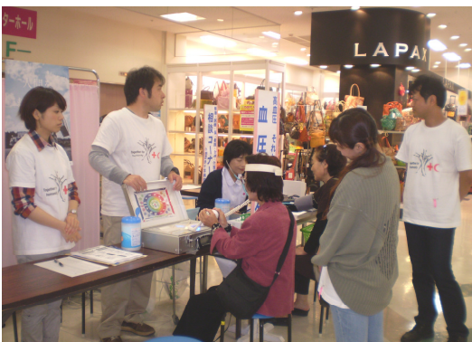
ストレス測定中・・・結果はどうか？

特に「けんけつちゃん」は子どもたちに大人気だったのですが、蒸し暑さのために、中の人（学生ボランティアさんだそうです）は休憩をとりながらの参加でした。