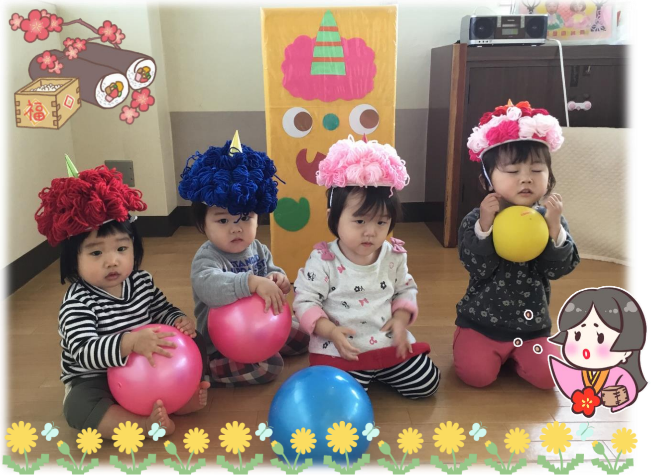
院内保育園きららの節分(2021.2.9撮影)