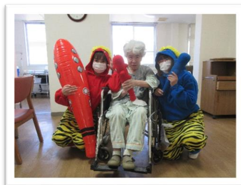
↑3病棟の節分の様子(2021.2.3 撮影)

ご存じの方も多いと思いますが、2021年の節分は、37年ぶりに日付が変わりました。節分とは、「鬼を追い払って新年を迎える、立春の前日の行事」です。現代は国立天文台の観測によって「太陽黄経が315度になった瞬間が属する日」を立春としています。2021年の立春の瞬間は、2月3日23時59分だったそうです。毎年何気なく過ごしていた節分ですが、改めて調べてみると知らなかったことが多い行事でした。皆さんも調べてみてくださいね。