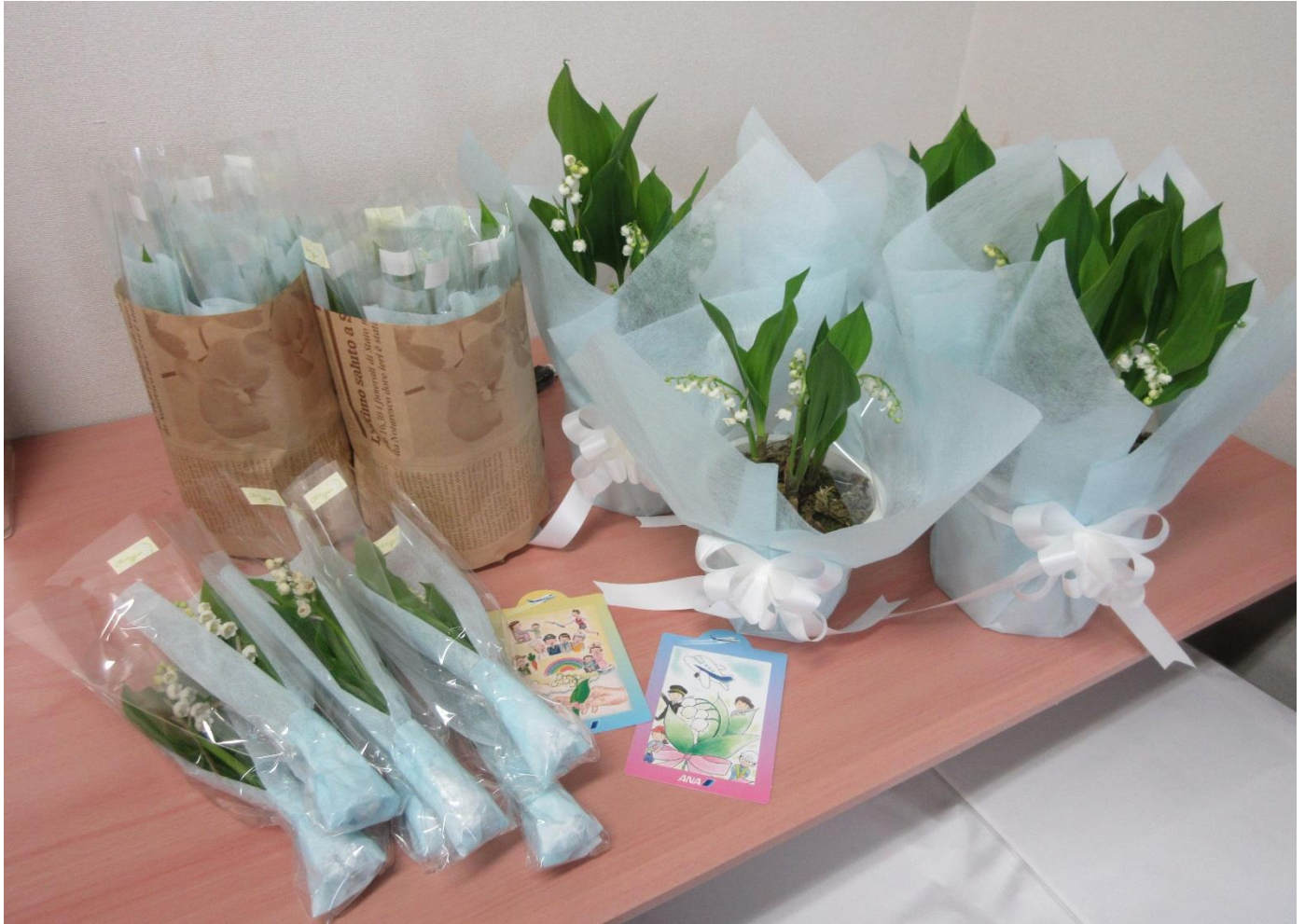
ANA グループさまより スズラン贈呈 (2021.5.26 撮影)